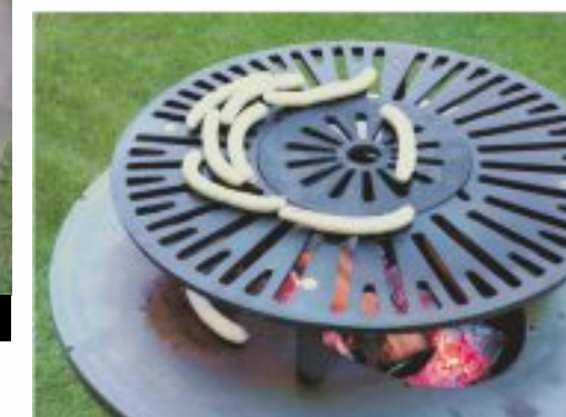
Górny ruszt – z częścią środkową Grillowanie wędlin i mięsa