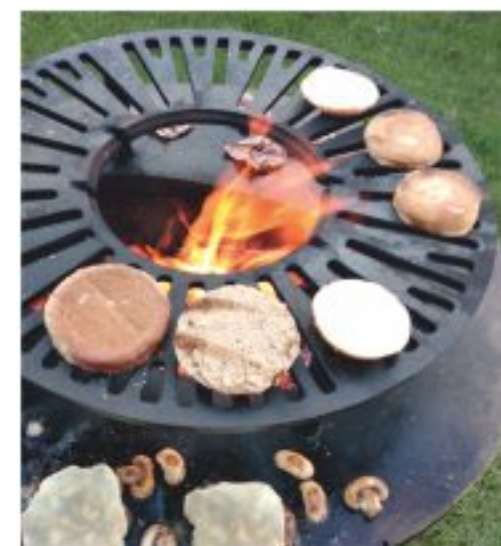
Górny ruszt – bez części środkowej Grillowanie mięsa i opiekanie pieczywa