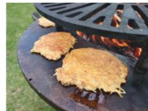
Płyta podstawowa do grilla Ø790 mm grillowanie warzyw, ryb i mięsa, pieczenie placków ziemniaczanych